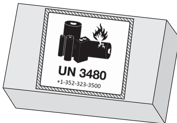
Bottom Box Face