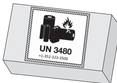
Face inférieure de la boîte