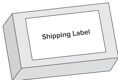
Cara superior de la caja

No doble las etiquetas sobre un borde ni las coloque en la misma cara de la caja.